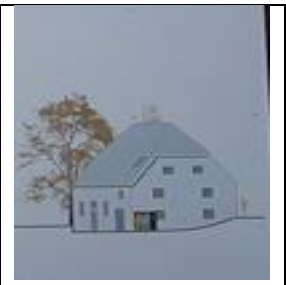
So wird es

Das Projekt Kaltenmühle untersteht nun mehr der GRWS – der Wohnungsbau- und Sanierungsgesellschaft der Stadt Rosenheim.