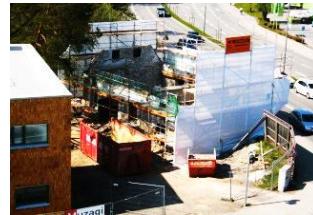
So ist es 2015