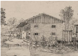
So war es im Jahr 1810