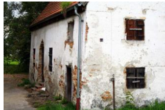
So im Jahr 2014